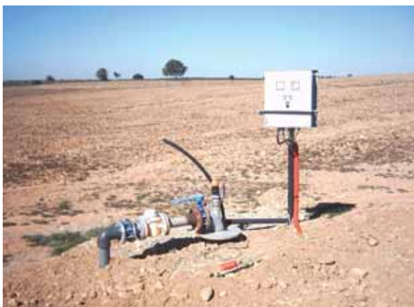
FIGURA 3. Sondeo para captación de aguas subterráneas (equipado con cuadro eléctrico) ubicado en el T. M. Linares (Jaén).

Contiene por tanto este documento una serie de propuesta de actuación que pretenden recuperar la credibilidad y la calidad de las políticas de uso y gestión de las aguas subterráneas en la provincia de Jaén (perfectamente útiles para otras provincias), que ejercen todas las partes interesadas (empresas, técnicos, gestores, usuarios, administración, etc.), a través de la mejora de los procesos de vigilancia e inspección en el desarrollo de nuevos proyectos, así como en la optimización de las ya existentes, consiguiendo por tanto un uso más racional de las aguas subterráneas de la provincia.