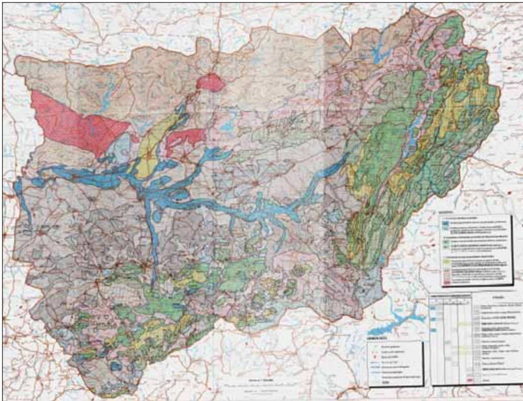
FIGURA 2. Mapa hidrogeológico de la provincia de Jaén.