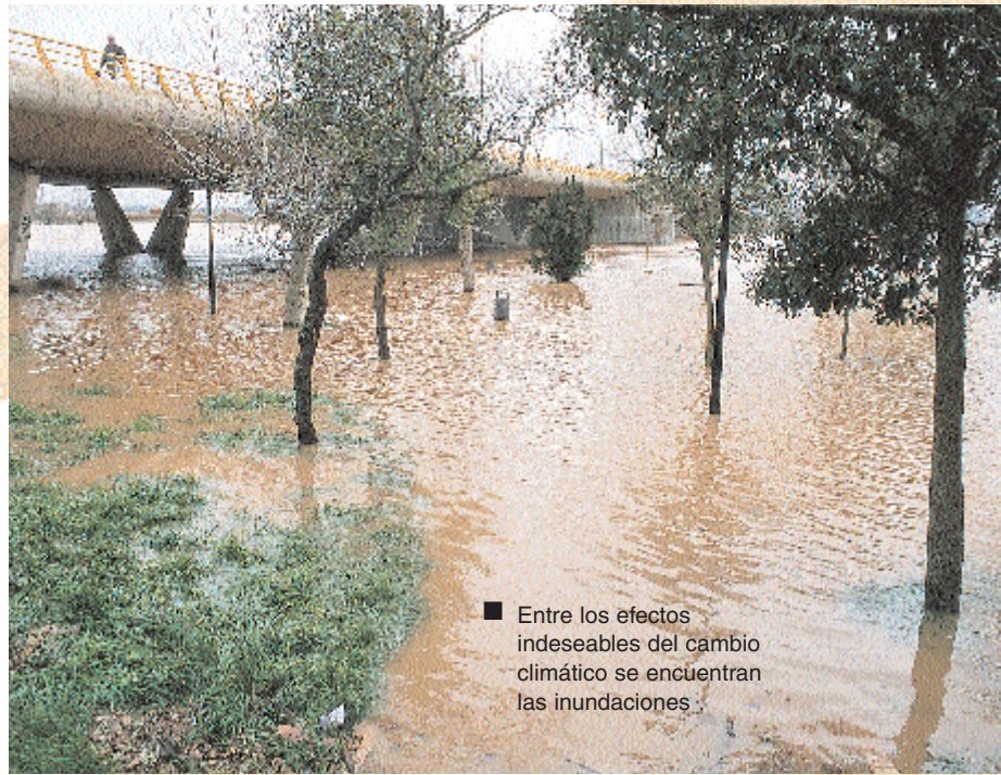
Entre los efectos indeseables del cambio climático se encuentran las inundaciones.

Otra de las iniciativas es el Plan Nacional de Residuos Urbanos 2000-2006, que tiene como objetivo prevenir la producción de residuos, promoviendo su reducción, la reutilización y el reciclado. Además, este Plan pretende el sellado