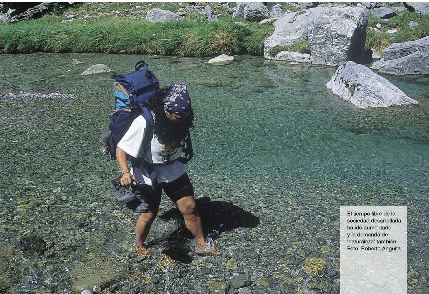
El tiempo libre de la sociedad desarrollada ha ido aumentando y la demanda de 'naturaleza' también.

Estos condicionantes son bastante menos laxos que los que permiten los formidables logros económicos (monetaristas) y de consumo a ultranza de las últimas décadas. La ropa, el calzado, el automóvil, el viaje de placer o el mobiliario que consume hoy el ciudadano medio de un país desarrollado constituyen sus objetivos prioritarios frente a la calidad ambiental que, de paso, también reclama a cambio de muy poco. En realidad, unos y otros objetivos no tienen que estar reñidos si se consiguen con sensatez. Pero