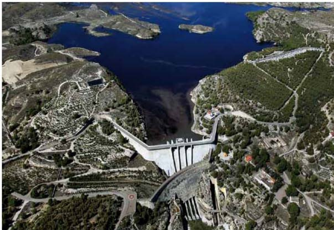
Fig. 1. Presas del Estrecho de Puentes (río Guadalentín). Tercera presa (1885) y cuarta (2000)

El 30 de abril de 1802 se produce la rotura de la presa de Puentes por sifonamiento en la cimentación, provocando una gran catástrofe en la que murieron 608 personas en