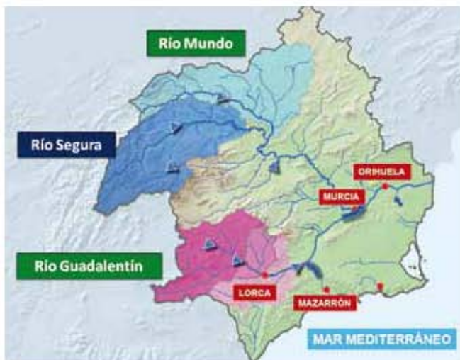
Fig. 4. Proyecto de obras de defensa frente a las inundaciones en el valle del Segura. Ramón García y Luis Gaztelu. 1886