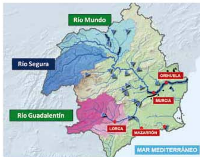
Fig. 5. Plan de defensa frente a inundaciones en la cuenca del Segura. 1937