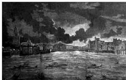
Fig. 3. Riada de Sta. Teresa (octubre 1879). Río Segura a su paso por Murcia (grabado de Gustavo Doré en la revista Paris-Murcia)

El 15 de octubre de 1879, día de la onomástica de Santa Teresa tuvo lugar una de las mayores catástrofes por inundaciones del mundo. Aunque tuvo su foco principal en el Guadalentín, se generalizó al resto de la cuenca del