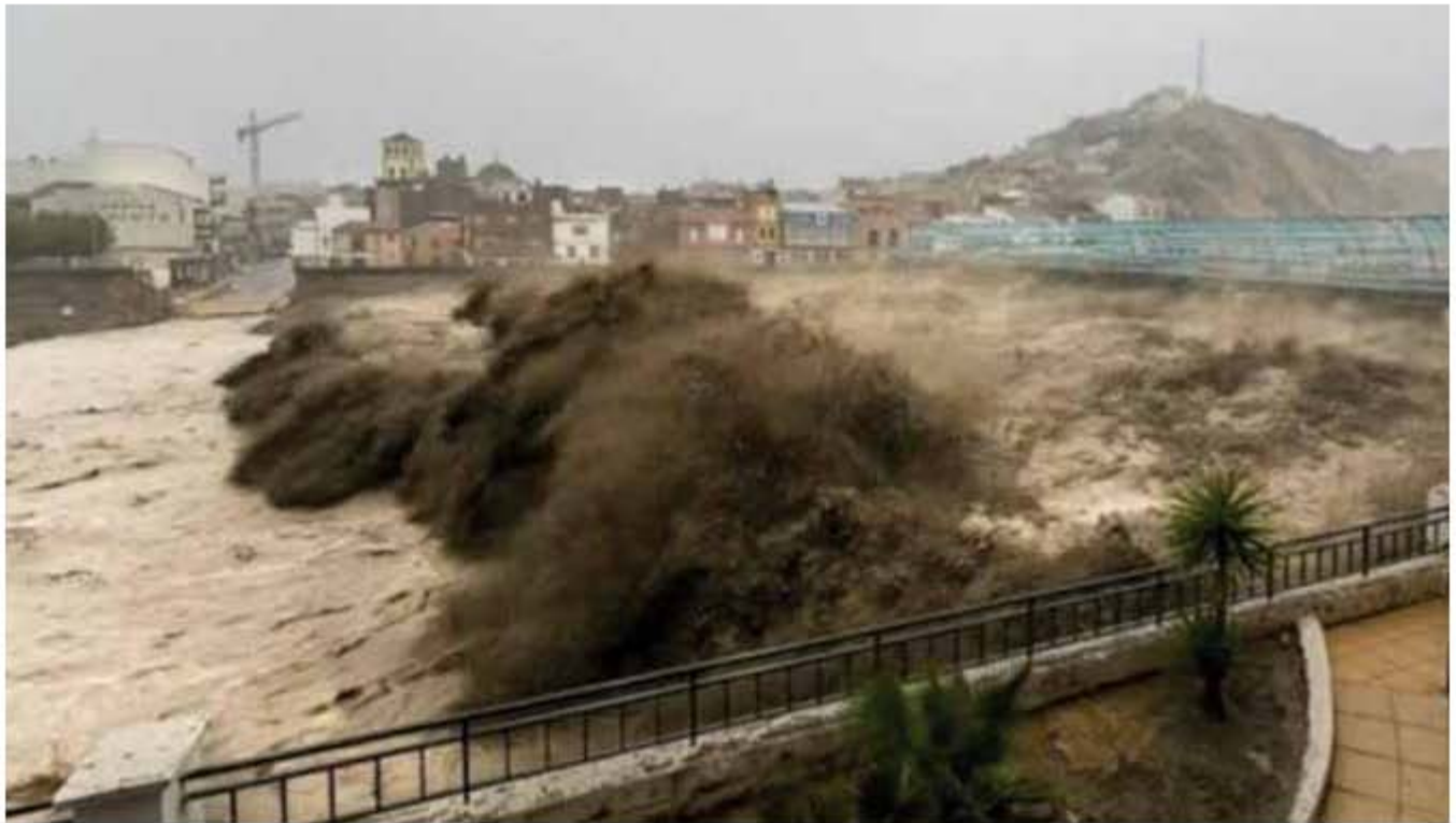
Figura 8. Rambla de Nogalte . 2.600 m 3 /s (Puerto Lumbreras). Riada de San Wenceslao. 2012

droológica (SAIH), terminado en 1992, que permite el registro y transmisión de los datos de los puntos de control más significativos de la cuenca en tiempo real.