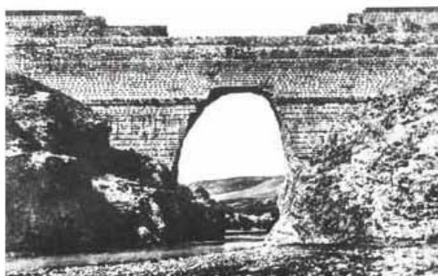
Fig. 2. Segunda presa de Puentes. Construida entre 1785 y 1798. Destruída en el 1802

Lorca. Se estima que se produjo un vaciado con una punta de caudal de 8.000 m 3 /seg. Don Agustín de Betancourt elaboró un informe sobre la rotura que condujo a la creación de los Estudios de la Inspección General de Caminos, también conocidos como estudios de Hidráulica del Buen Retiro, el origen de la Escuela de Ingenieros de Caminos y Canales. Con posterioridad se construirían la tercera (1881) y cuarta presa (2000) de Puentes que se referirán más adelante.