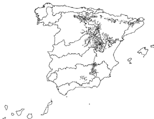
Tipo 12. Ríos de montaña mediterránea calcárea