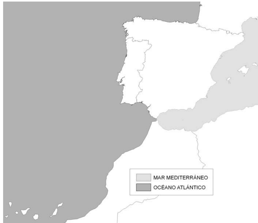
Figura 3. Regiones ecológicas de aguas de transición y costeras

Las regiones ecológicas de las aguas de transición y costeras serán el Océano Atlántico y el Mar Mediterráneo, como se muestra en la figura 3.