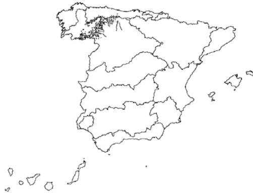
Tipo 25. Ríos de montaña húmeda silíceas