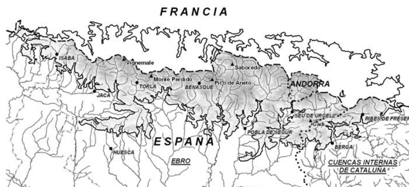
Figura 2. Detalle de la parte española de la región ecológica Pirineos

La región de los Pirineos queda delimitada por la zona pirenaica situada por encima de 1.000 m de altitud y comprende parte de la cuenca del Ebro y de las Cuencas Internas de Cataluña, según se detalla en la figura 2.