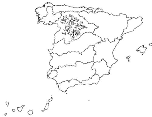
Tipo 4. Ríos mineralizados de la Meseta Norte