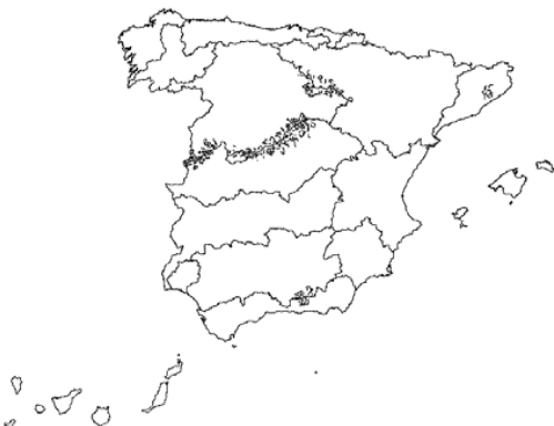
Tipo 11. Ríos de montaña mediterránea silícea