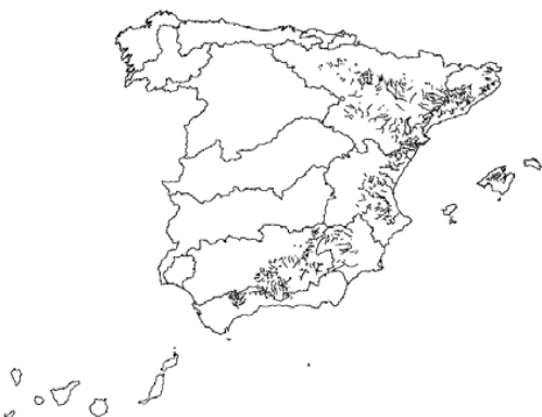
Tipo 9. Ríos mineralizados de la baja montaña mediterránea