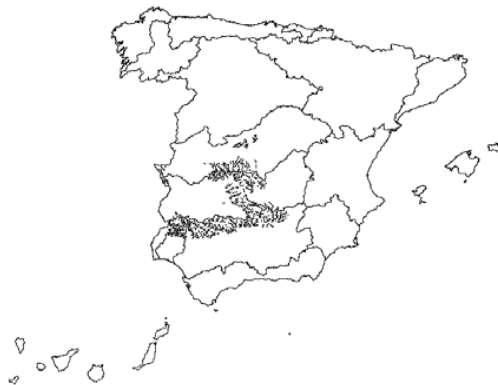
Tipo 8. Ríos de la baja montaña mediterránea silícea