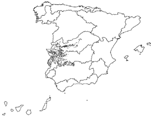
Tipo 1. Ríos de llanuras silíceas del Tajo y Guadiana