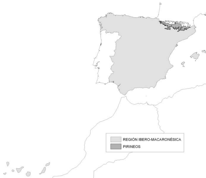
Figura 1. Regiones ecológicas de ríos y lagos

La región de los Pirineos queda delimitada por la zona pirenaica situada por encima de 1.000 m de altitud y comprende parte de la cuenca del Ebro y de las Cuencas Internas de Cataluña, según se detalla en la figura 2.