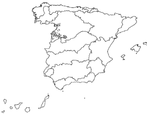
Tipo 3. Ríos de las penillanuras silíceas de la Meseta Norte