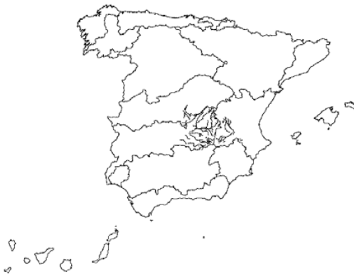
Tipo 5. Ríos manchegos