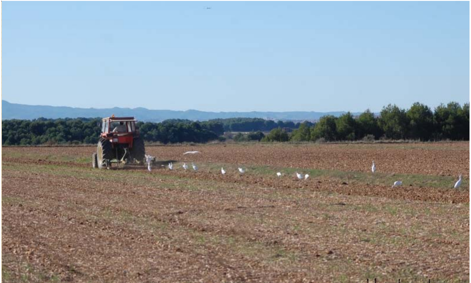
Tractor y Garcillas bueyeras ( Bubulcus ibis )